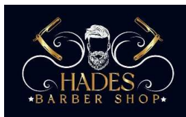
SPONSOR KLASYFIKACJI DRUŻYNOWEJ