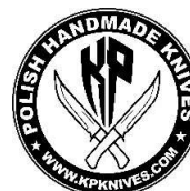
AUTOR NAGRODY DODATKOWEJ